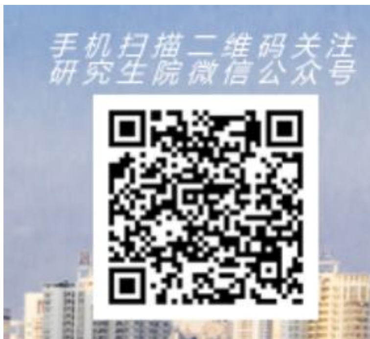
广西医科大学研究生院微信公众号